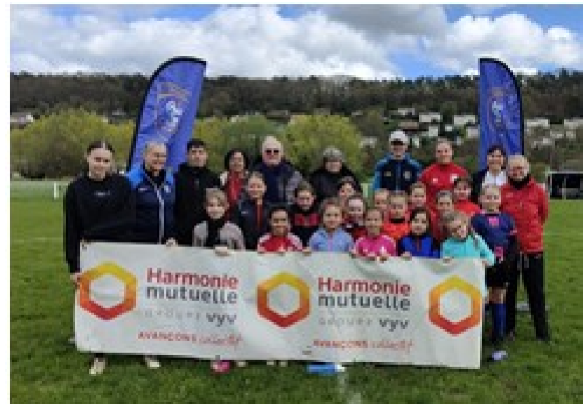
Mercredi 03 Avril à Brionne 17 joueuses présentes 6 clubs