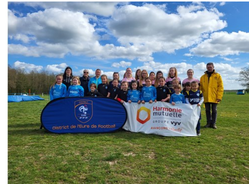
Mercredi 10 Avril à la Barre en Ouche 12 joueuses présentes 4 clubs