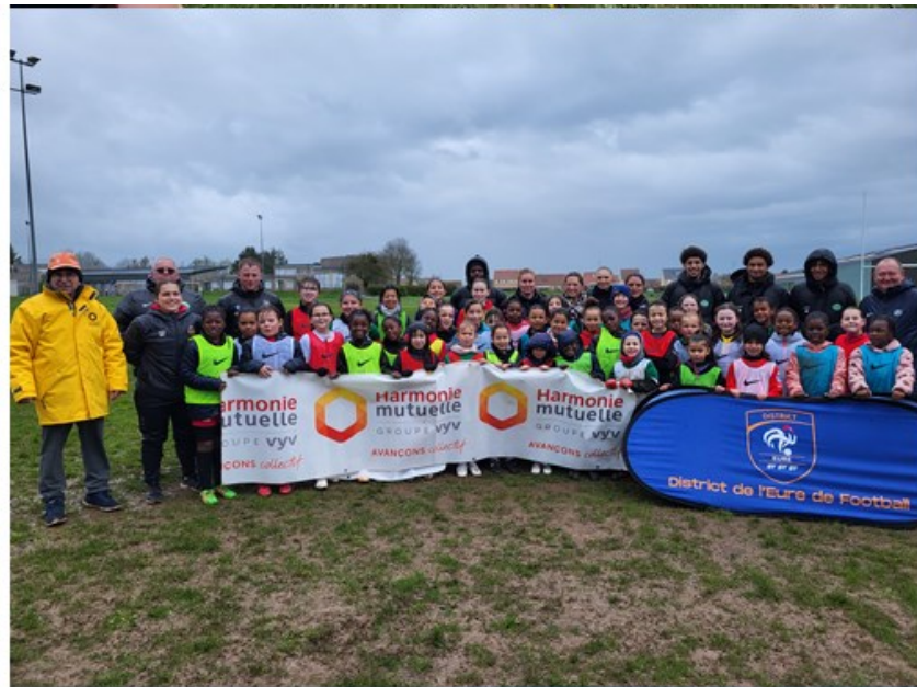
Mercredi 27 Mars à Saint André de l'Eure 40 joueuses présentes 5 clubs

La tournée événementielle s'est déroulée sur 4 dates