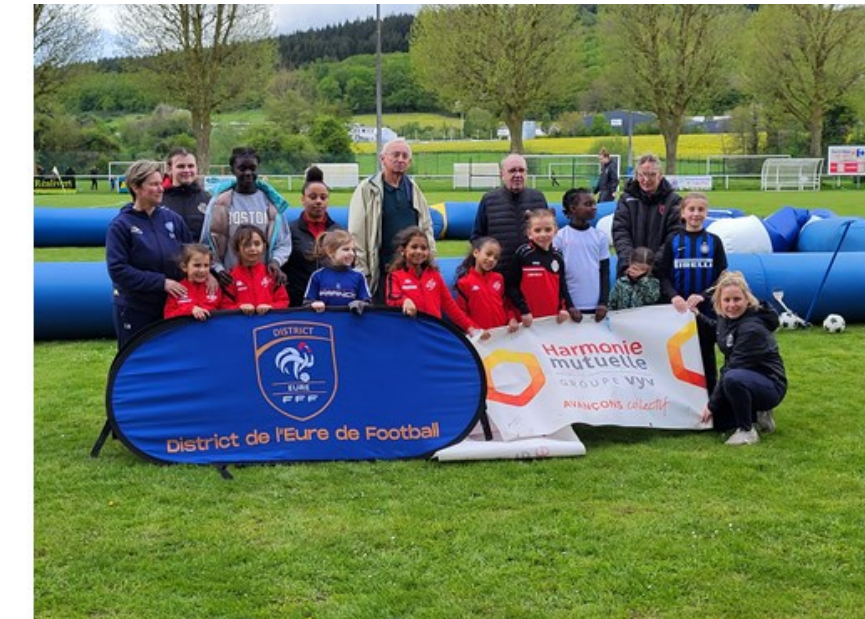
Mercredi 17 Avril à Charleval 9 joueuses présentes 5 clubs

Afin de clôturer cette première édition, l'ensemble des participantes ont été convié avec leur famille au dernier match à domicile du HAC féminines les opposant à Fleury 91 (136 personnes présentes). En amont du match, les filles ont réalisé un plateau sur les installations du complexe Youri Gagarine organisé par les femmes inscrites à l'AF pratique féminine.