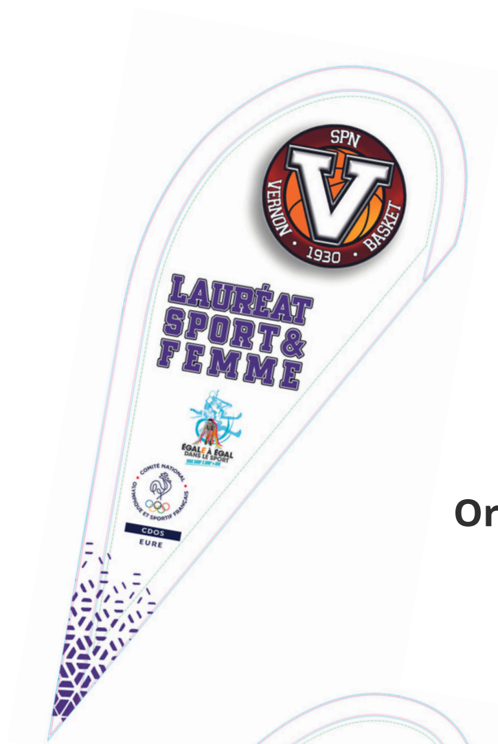
Oriflammes aux couleurs du club